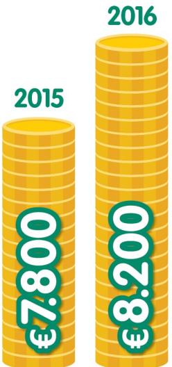
Verzuimkosten per werknemer wegens werkstress.